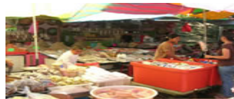
タム(オープンマーケット)