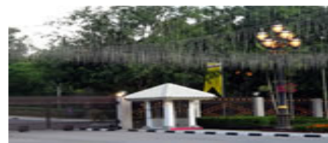
イスタナ・ヌルル・イマン(王宮)